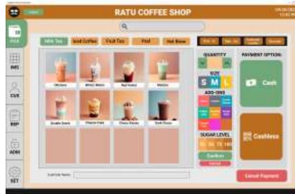
Gambar 5. Hasil Program Halaman POS

terjadi pada proses manual (Sipayung et al. 2022).