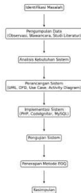
Gambar 1. Diagram Alur Penelitian

Penelitian ini menggunakan pendekatan kuantitatif dengan jenis penelitian perancangan dan pengembangan sistem informasi. Objek penelitian adalah proses transaksi penjualan dan pengelolaan persediaan bahan baku pada Ratu Caffe. Tahapan penelitian dimulai dari identifikasi permasalahan, pengumpulan data, analisis kebutuhan sistem, perancangan sistem, implementasi, hingga pengujian sistem (Putri, 2024). Alur tahapan penelitian tersebut dapat dilihat pada Gambar berikut.