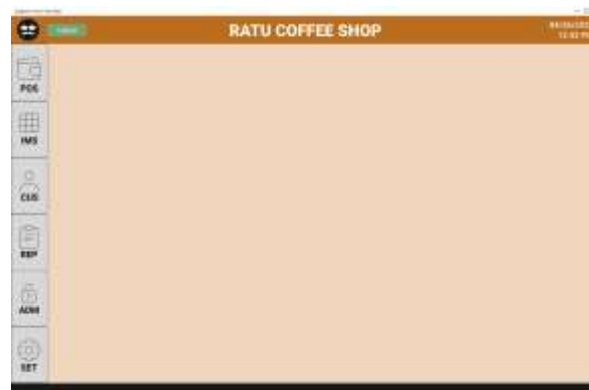
Gambar 4. Hasil Program Halaman Utama

Setelah berhasil masuk, pengguna diarahkan ke halaman utama (dashboard) yang menampilkan ringkasan informasi operasional. Halaman ini menyajikan informasi jumlah transaksi, data stok, serta menu navigasi menuju fitur-fitur utama sistem. Dashboard berfungsi sebagai pusat kontrol yang memudahkan pengguna memantau kondisi operasional secara umum sebelum melakukan aktivitas lainnya.