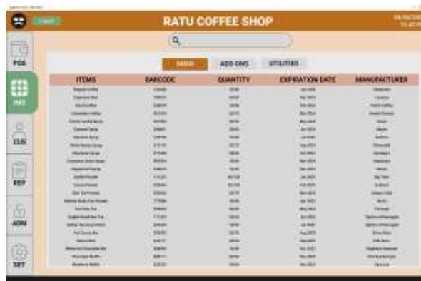
Gambar 6. Hasil Program Halaman EOQ

Selain mendukung transaksi penjualan, sistem juga menyediakan fitur manajemen stok yang terintegrasi dengan metode Economic Order Quantity (EOQ). Pada halaman ini, pengguna dapat melihat data persediaan bahan baku, memasukkan parameter perhitungan, serta memperoleh hasil analisis jumlah pemesanan optimal dan titik pemesanan kembali (reorder point). Fitur ini membantu pengguna dalam merencanakan pembelian bahan baku secara lebih efisien dan terukur (Hasmia et al. 2022).