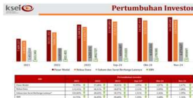
Gambar 1. Pertumbuhan Investor

Mahasiswa merupakan salah satu kelompok yang sangat dekat dengan perkembangan teknologi digital. Tingginya penggunaan internet dan media sosial membuat mahasiswa lebih mudah memperoleh informasi mengenai berbagai produk dan instrumen investasi. Di sisi lain, kemudahan akses informasi tersebut juga menghadirkan tantangan baru karena tidak semua informasi yang beredar memiliki tingkat akurasi yang baik. Informasi mengenai investasi sering kali disampaikan secara singkat melalui media sosial tanpa disertai penjelasan mengenai risiko yang mungkin terjadi. Akibatnya, sebagian individu dapat mengambil keputusan investasi hanya karena mengikuti tren atau rekomendasi pihak lain tanpa melakukan analisis yang memadai.